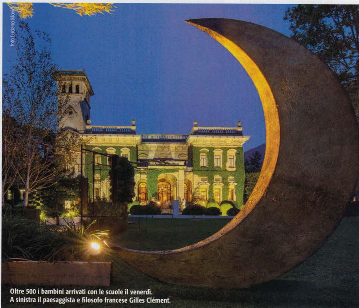
Oltre 500 i bambini arrivati con le scuole il venerdì. A sinistra il paesaggista e filosofo francese Gilles Clément.

L a nona edizione di Orticolario ha sbarragliato le aspettative, rivelandosi ancor più bella e seducente delle precedenti. Merito indubbiamente dalla cornice, la superba Villa Erba sul Lago di Como, ma anche e soprattutto dell'impegno degli organizzatori e della qualità degli espositori