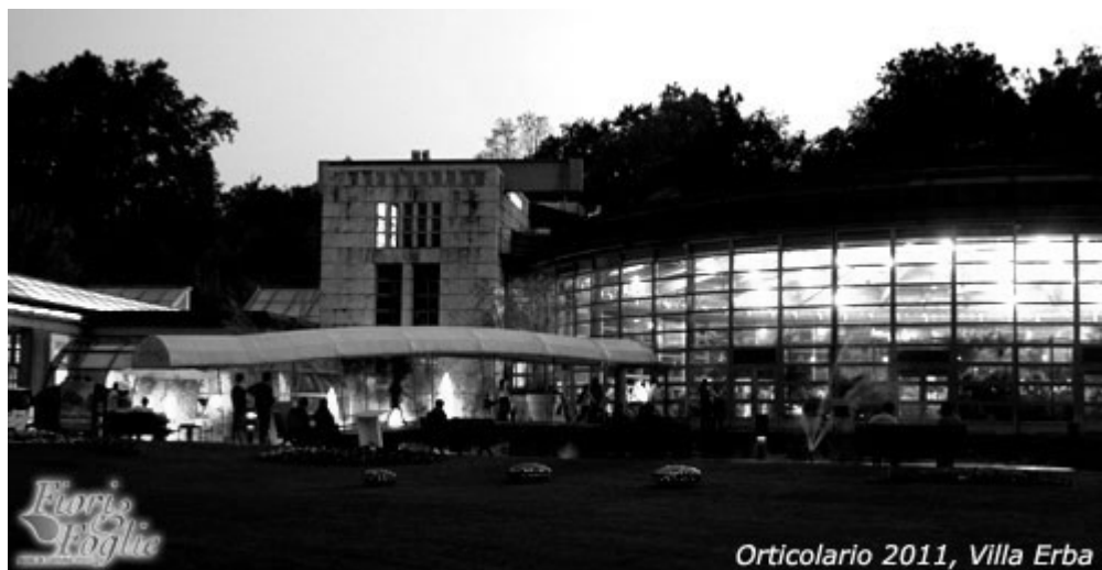
Orticolario 2011, Villa Erba

Cala la sera e il parco secolare di Villa Erba si accende di giochi di luce : nel laghetto di fronte alla grande struttura a serra, tronchi infuocati sprizzano scintille tra le fiamme, si accendono torce targate "Orticolario" che fanno da contrappunto ad ogni sentiero, mentre grandi lampade cambiano colore nel buio tra gli alberi e nel prato eleganti sagome e forme scolpite in lamiera cor-ten, create dagli scultori de Il guardiano delle Acque , fanno intravedere bagliori di fuoco. Con questo spettacolo, favorito anche dal bel tempo, si è chiusa la giornata inaugurale di Orticolario, mostra-mercato di piante e fiori che venerdì scorso ha aperto in pompa magna la sua terza edizione a Cernobbio, Como.