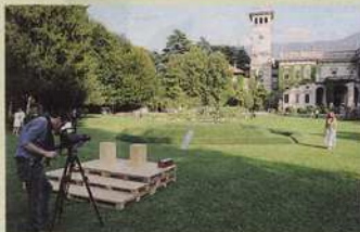
A sinistra, il gruppo Olo Creative Farm al lavoro ieri pomeriggio nel parco di Villa Erba. A destra, Tina Nyheim, la norvegese protagonista della clip promozionale dell'evento espositivo