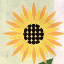
A cura di Marcello Dubini e Lorenzo Morandotti Grafica di Paola Praticò.