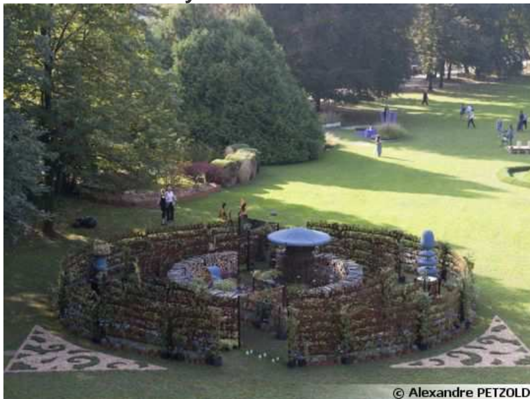
Le Jardin BioLabyrinthus à Orticolario 2014