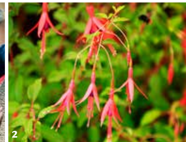
2. Fuchsia magellanica 'Gracilis'.