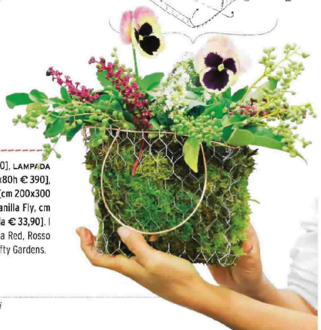
progetto e disegni di Silvia Magnano