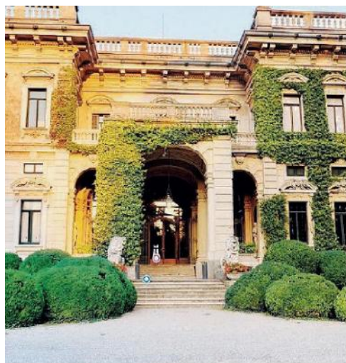
Da sinistra, Villa Erba e il padiglione centrale del centro espositivo