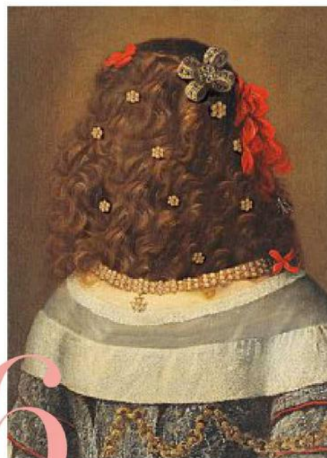
Hidden Nuvolone di Volker Hermes (2020).

Nella vita capita di cambiare taglia... anche nel gioiello. Per questo Chimento ha brevettato il meccanismo Size-Fit™ che estende la vestibilità di anelli in oro bianco e diamanti fino a cinque taglie: da tramandare o indossare in totale tranquillità.